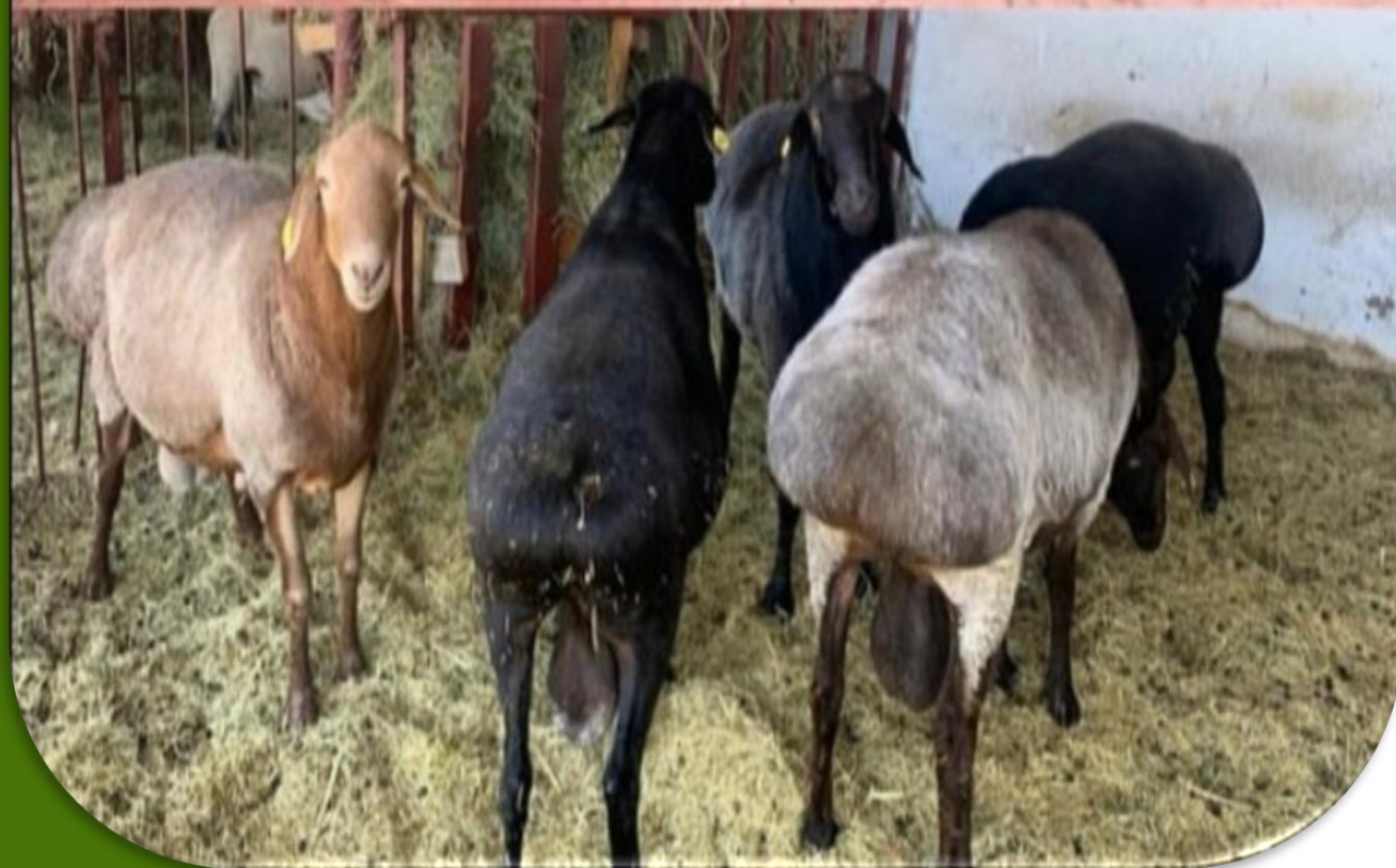
Племенные быки, бараны-производители отечественной и зарубежной селекции