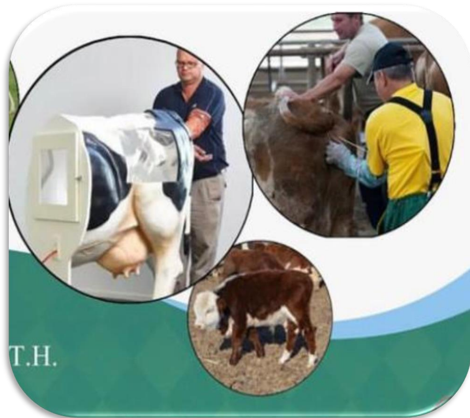
Услуги искусственного осеменения коров и телок