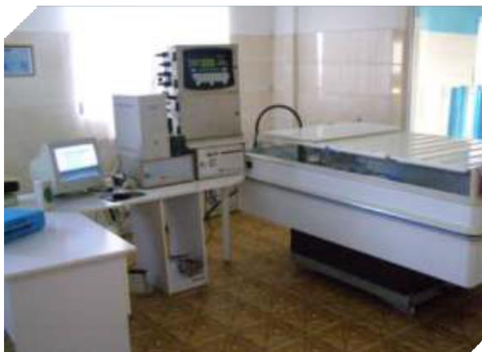
Современное технологическое оборудование