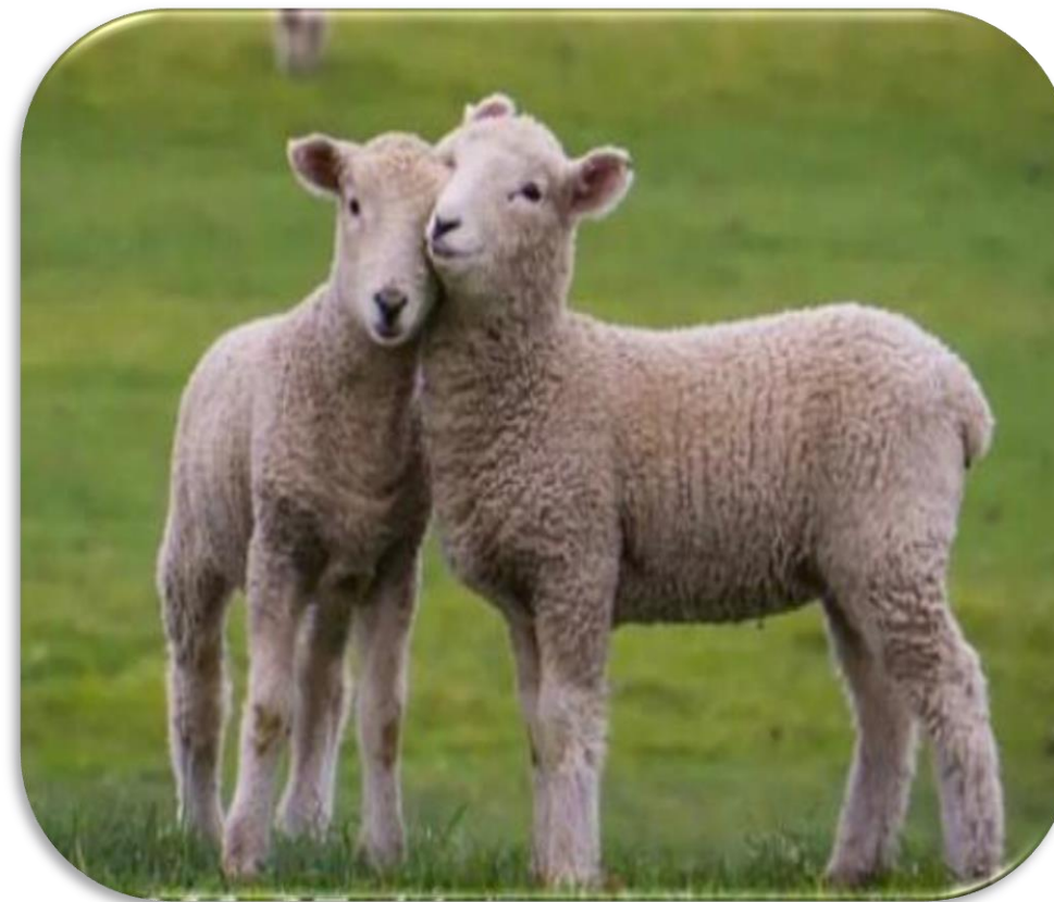
Услуги искусственного осеменения овец и ярок