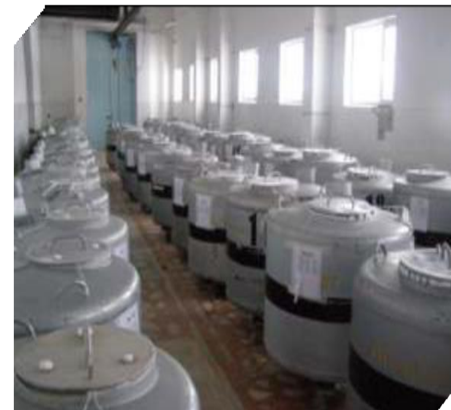
Спермохранилище племенных быков-производителей