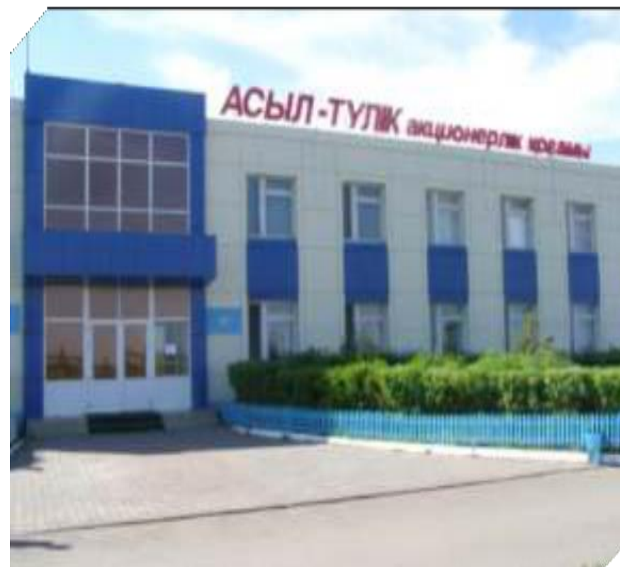
Офис АО «РЦПЖ "Асыл түлік"»